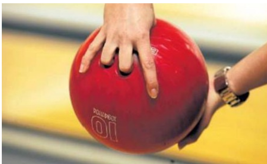
Správné držení koule