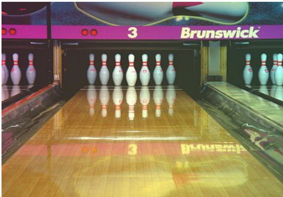
Pohled na postavené kuželky